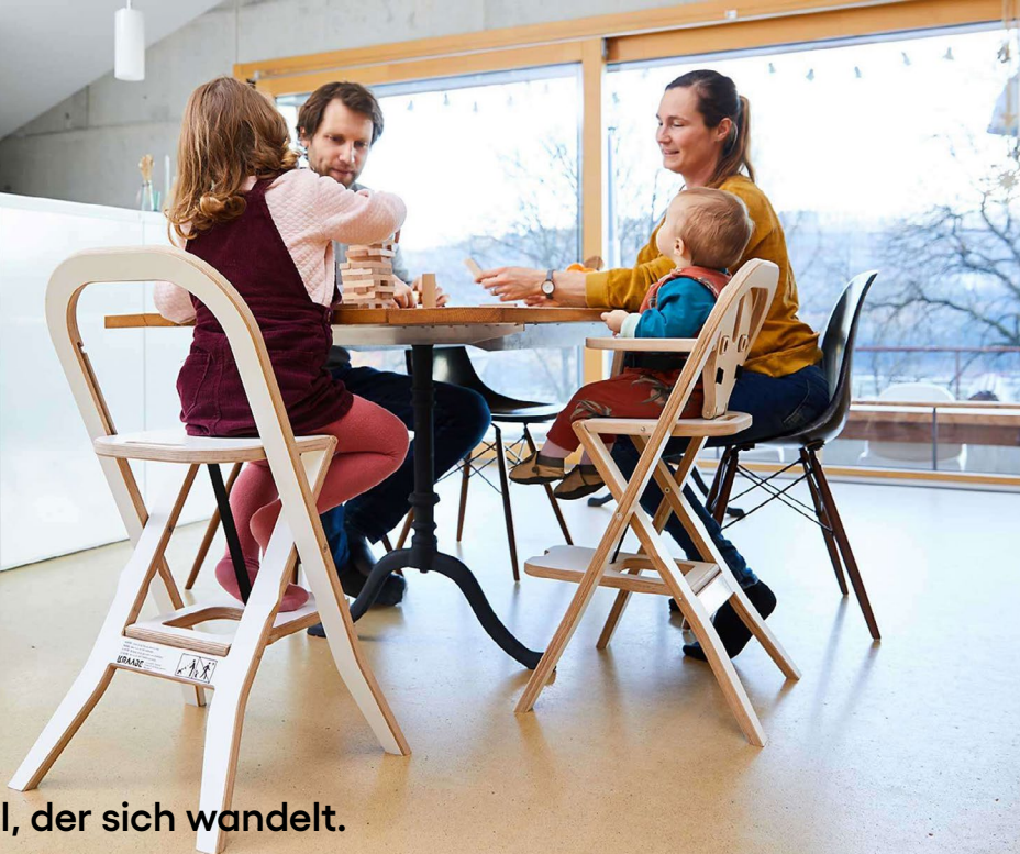
Der Stuhl, der sich wandelt.