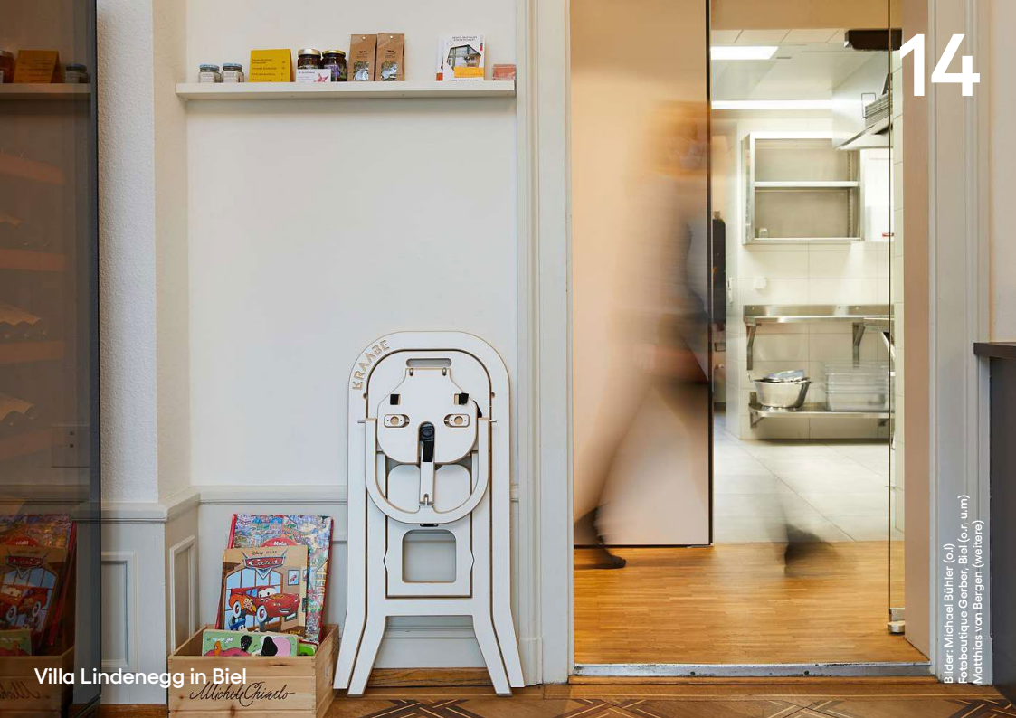
Villa Lindeneegg in Biel

BEATUS Wellness- & Spa-Hotel in Merligen am Thunersee